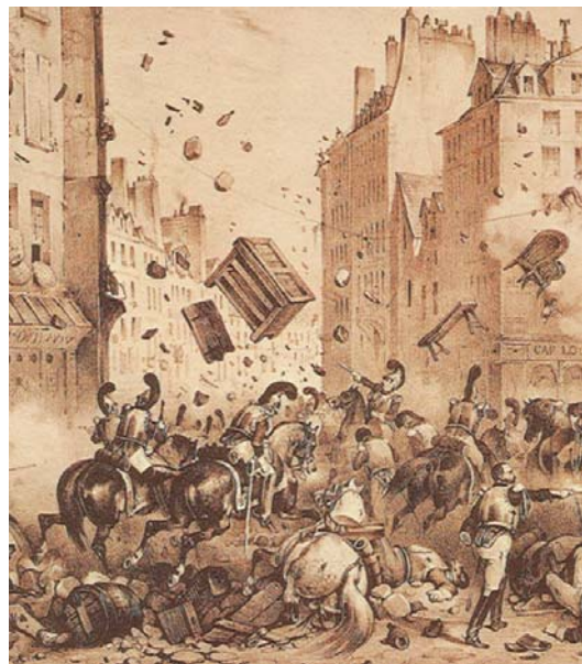
Párizs, 1830 július